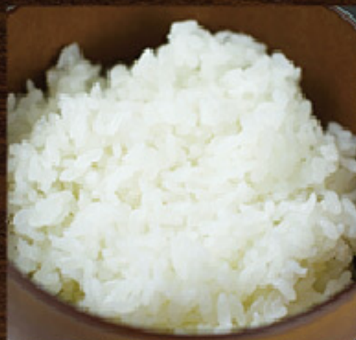
ライス (おかわり自由) ¥350 (税込¥385)