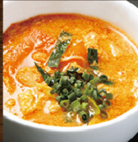
牛骨 玉子スープ 赤 (唐辛子) ¥380 (税込¥418)