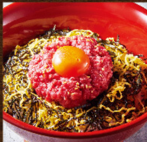
将泰庵 トロける炙り ミニユッケ丼 ¥850 (税込¥935)