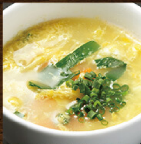
牛骨 玉子スープ 白 (塩) ¥380 (税込¥418)